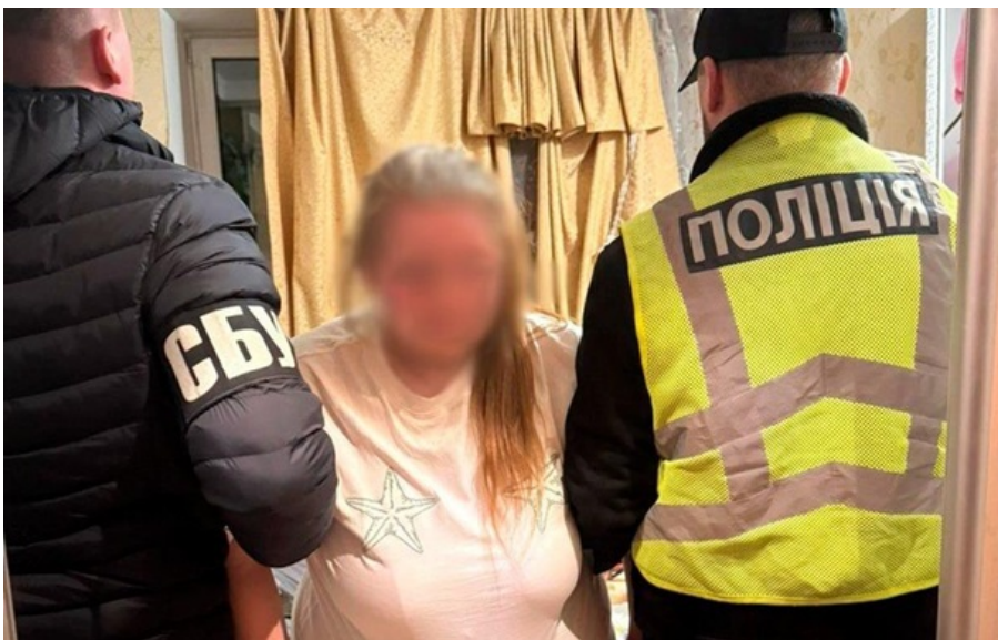
Агентці загрожує довічне ув'язнення з конфіскацією майна

У поле зору росіян мешканка Одеської області потрапила, коли шукала у Телеграм-каналах "швидкі заробітки на дозу".