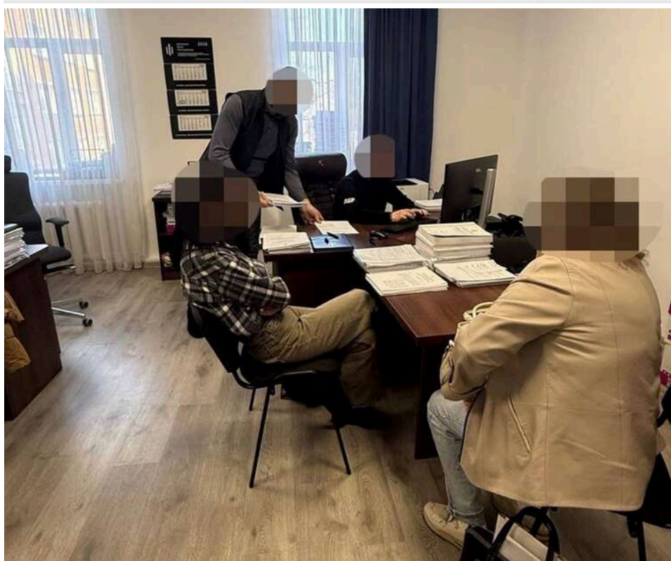
У Рівненській області екслісничу судитимуть за незаконну вирубку 140 дерев на 4,8 мільйона гривень

Екологічні прокурори Рівненської обласної прокуратури скерували до суду обвинувальний акт стосовно посадовці, якій інкримінують організацію незаконної вирубки 140 дерев. Вони росли в садку площею 0,7 га на території Клеванського лісництва.