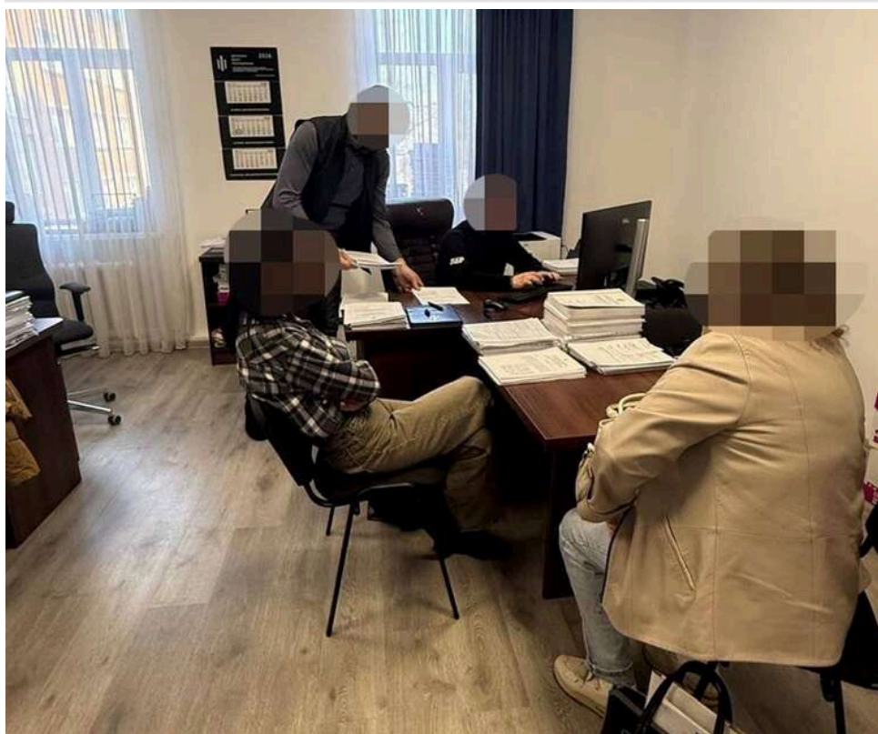
У Рівненській області екслісничу судитимуть за незаконну вирубку 140 дерев на 4,8 мільйона гривень

Екологічні прокурори Рівненської обласної прокуратури скерували до суду обвинувальний акт стосовно посадовці, якій інкримінують організацію незаконної вирубки 140 дерев. Вони росли у садку площею 0,7 га на території Клеванського лісництва.