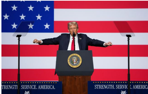
Фото: президент США Дональд Трамп (Getty Images)

Обирайте перевірене - додайте РБК-Україна до улюблених джерел у Google