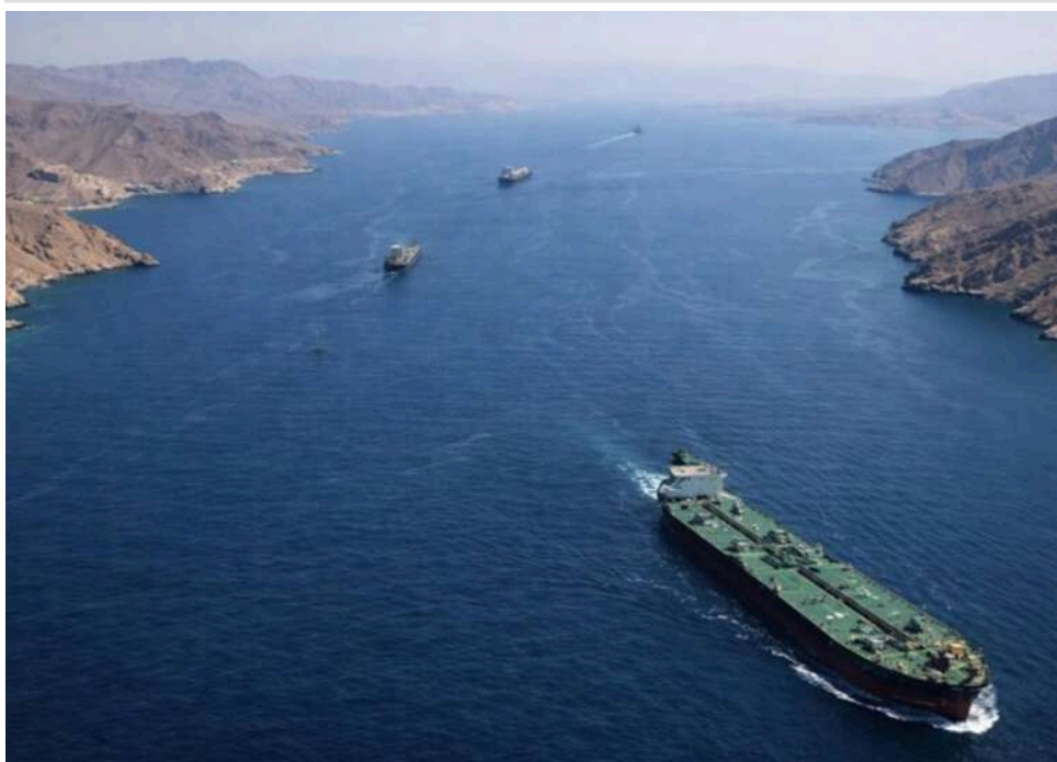
США атакували іранське судно в Оманській затоці: Тегеран заявив про порушення перемир'я та удар у відповідь

Сполучені Штати завдали удару по іранському судну в Оманському заливі. Тегеран звинуватив у порушенні перемир'я та пообіцяв відповідні дії.