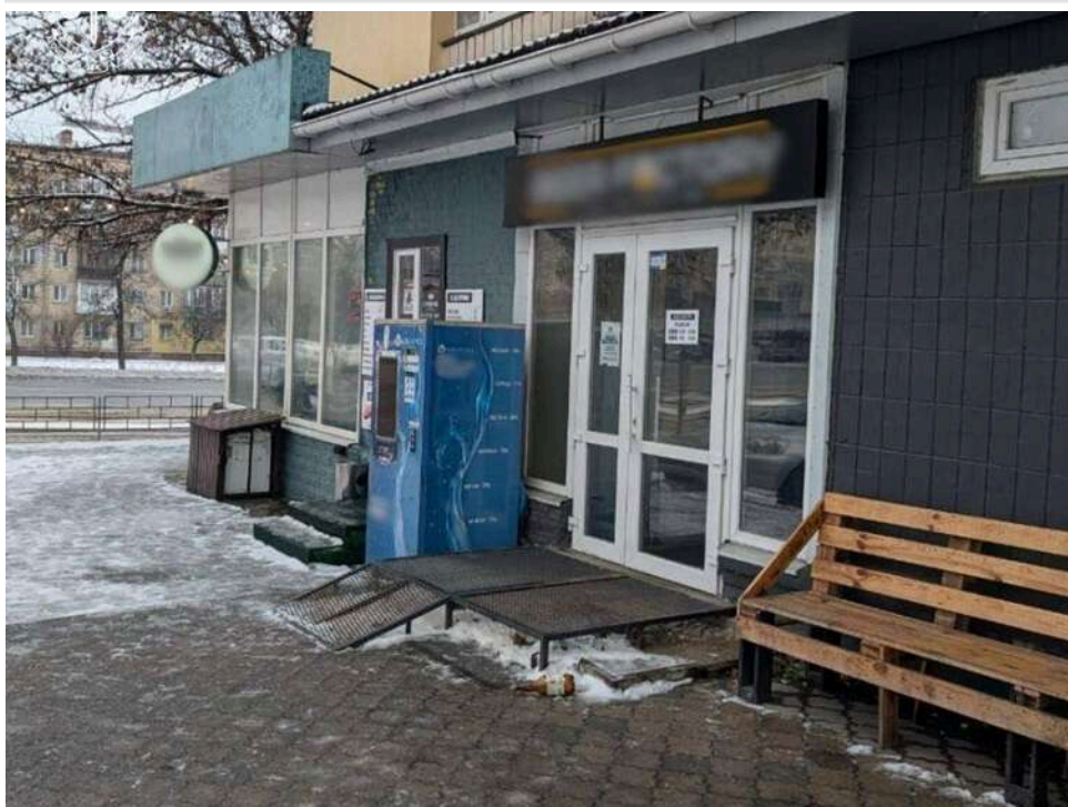
У Києві ексінспектора РДА судитимуть за вимагання 1500 доларів хабаря у власника водоматів

Дніпровська окружна прокуратура міста Києва скерувала до суду обвинувальний акт щодо колишнього інспектора відділу благоустрою та екології Дніпровської РДА. Чоловіка обвинувачують у вимаганні та отриманні неправомірної вигоди за ч. 3 ст. 368 КК України. Затримали його в лютому 2026 року безпосередньо під час отримання коштів.