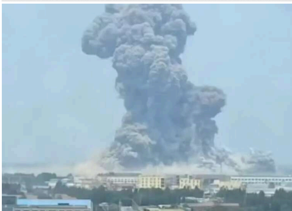
У Китаї стався вибух на заводі феєрверків Huasheng: 26 загиблих і понад 60 поранених

У Китаї в провінції Хунань учора вдень стався вибух на виробництві феєрверків Huasheng. Пожежа спричинила загибель 26 людей, а ще 61 людина була поранена.