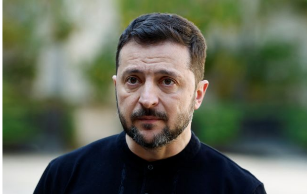
Фото: президент України Володимир Зеленський (Getty Images)

Обирайте перевірене - додайте РБК-Україна до улюблених джерел у Google