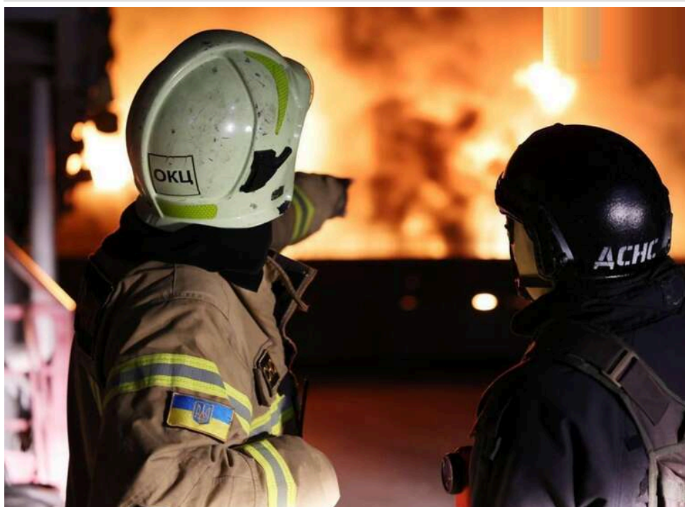
«Абсолютний цинізм»: Зеленський відреагував на масований удар РФ по енергетиці та вбивство рятувальників

Російські війська здійснили масовану атаку на енергетичну інфраструктуру України, застосувавши тактику «подвійного удару» проти працівників ДСНС. Найбільш трагічні наслідки зафіксовано на Полтавщині, де окупанти вбили Героїв-рятувальників.