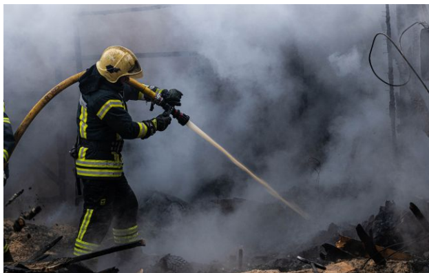
Фото: Трагедія на Полтавщині: через повторний удар РФ загинули рятувальники

Обирайте перевірене - додайте РБК-Україна до улюблених джерел у Google