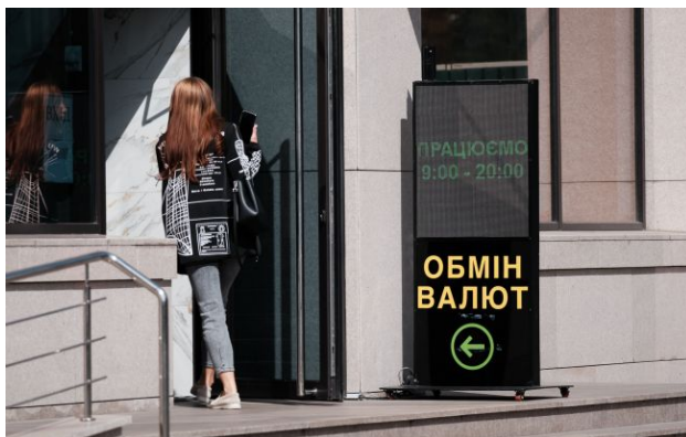
Фото: обмінники та банки оновили курс валют

Обирайте перевірене - додайте РБК-Україна до улюблених джерел у Google