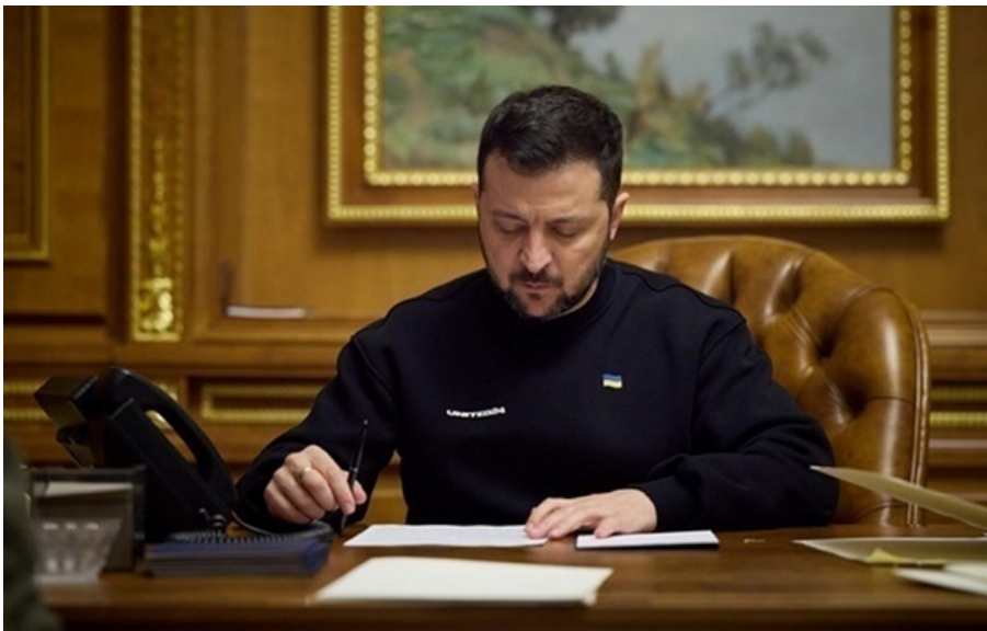
Президент Володимир Зеленський підписав укази щодо санкцій

До санкційного списку увійшов 121 окупант, причетний до нанесення масованих ракетних ударів по Україні. У санкційному списку щодо релігійних діячів-пропагандистів - дев'ять осіб.