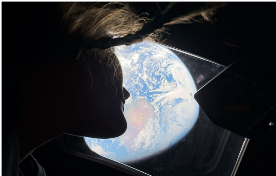
Місія Artemis II

Вже незабаром астронавти здійснять перший із 1972 року проліт повз Місяць.