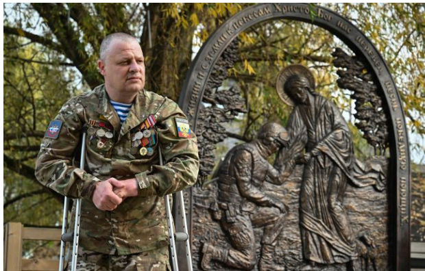
Фото: російський військовий (Getty Images)

Обирайте перевірене - додайте РБК-Україна до улюблених джерел у Google