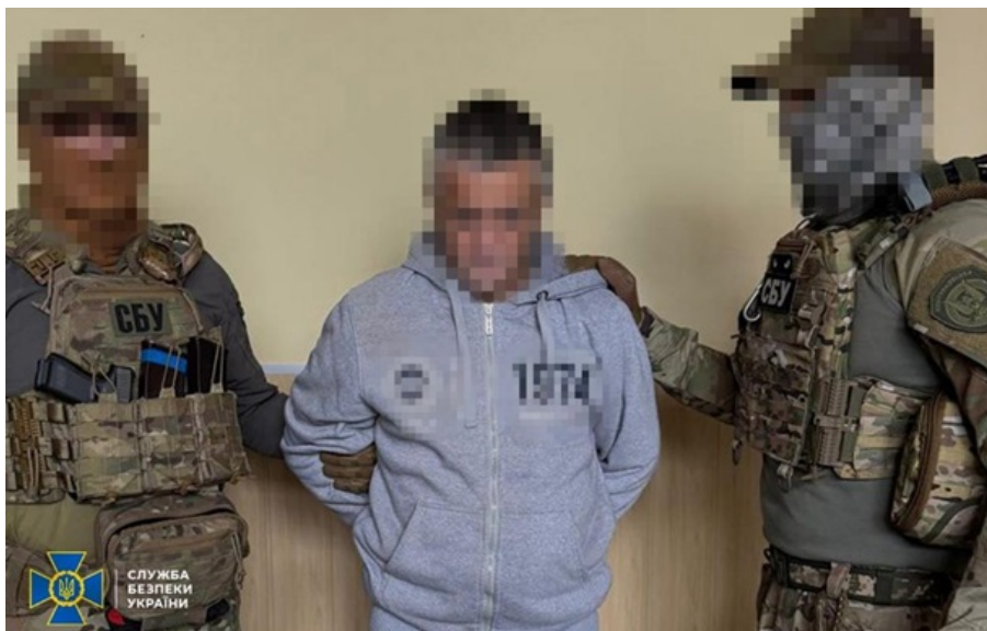
Агенту загрожує довічне ув'язнення з конфіскацією майна

ФСБ завербувала чоловіка у жовтні 2025 року, коли той шукав легкі заробітки в Телеграм-каналах.