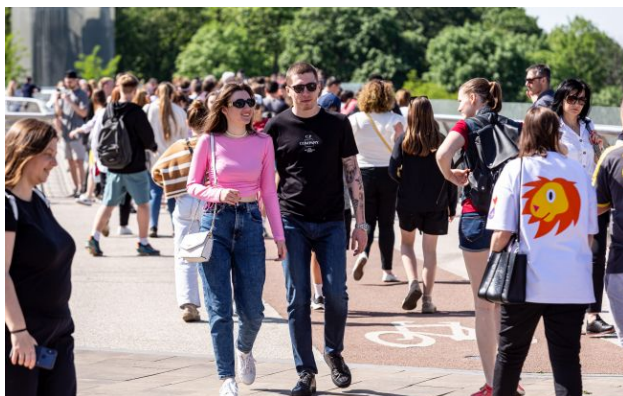
Фото: синоптики дали прогноз погоди на 5 травня

Обирайте перевірене - додайте РБК-Україна до улюблених джерел у Google