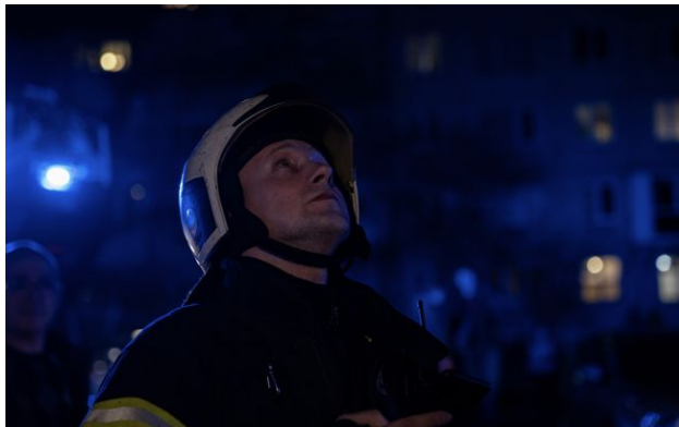
Фото: станом на ранок наслідки атак ще уточнюються (facebook.com/DSNSPOLTAVA)

Росіяни в ніч з 19 на 20 квітня вчергове атакували дронами Україну. Під удар ворога потрапили кілька міст, і в кожному з них зафіксовані наслідки.