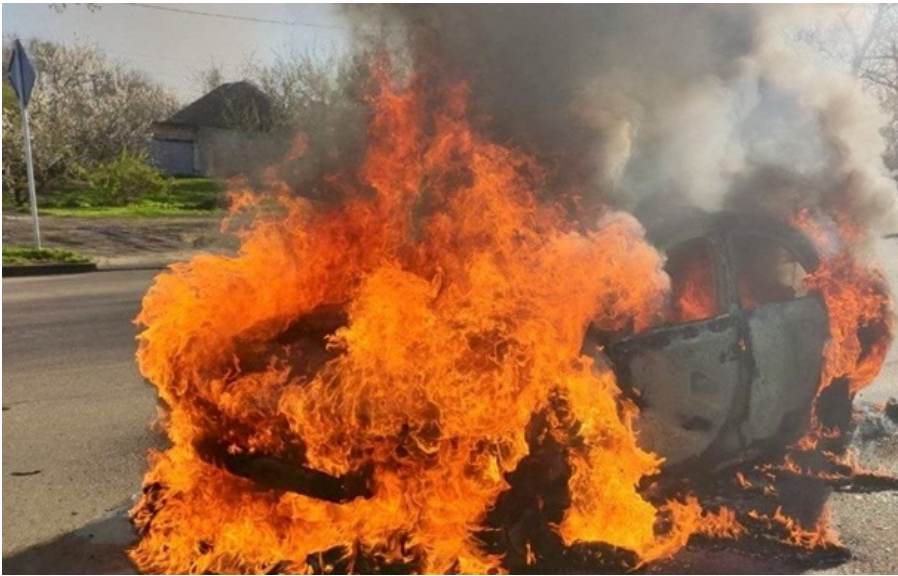
Наслідки чергового удару РФ

Загалом постраждали четверо жінок, двох із них госпіталізували. Тоді як 62-річна пацієнтка перебуває у важкому стані.