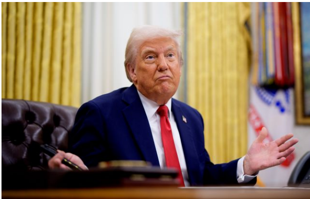
Фото: Дональд Трамп (Getty Images)

Обирайте перевірене - додайте РБК-Україна до улюблених джерел у Google