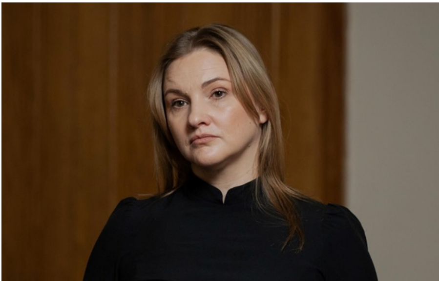
Військовий омбудсмен Ольга Решетилова

Військові отримували бойові виплати, які передавали керівництву, розповіла Ольга Решетилова.