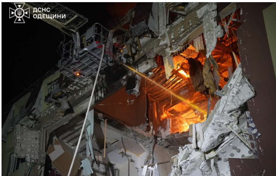
Влучання в будинок в Одесі

На будівлях приспущено прапор України та прапор Одеси з траурними стрічками. Усім підприємствам та організаціям рекомендовано обмежити розважальні заходи та використання музики.