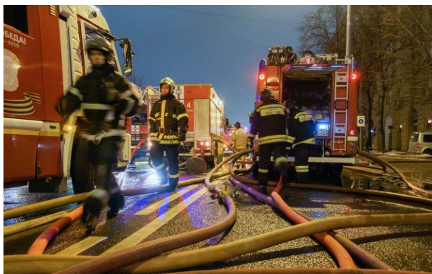
Фото: наразі в найдалшому регіоні вже відбій

Обирайте перевірене - додайте РБК-Україна до улюблених джерел у Google