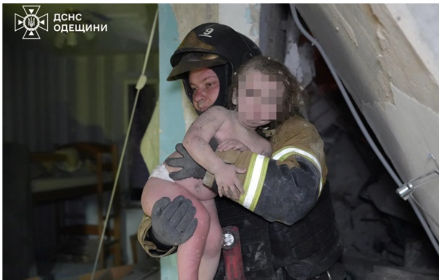
Рятувальник виносить дитину зі зруйнованого будинку в Одесі

Україні разом з партнерами потрібно разом посилювати захист неба, щоб відсоток збиттів дронів та ракет щоразу ставав вищим, зазначив президент.