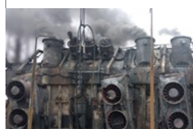
Пошкоджено енергооб'єкти п'яти областей України 6 квітня 2026, 10:34