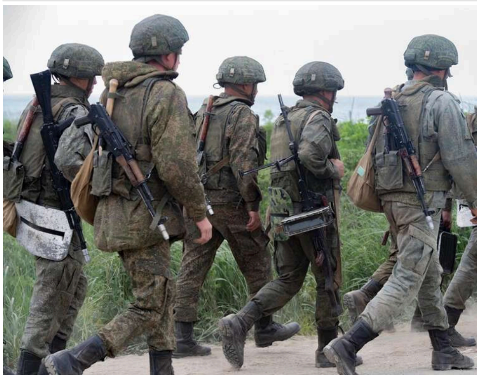
РФ готує штурми на Майське та Віролюбівку: росіяни посилюють сили на Краматорському напрямку