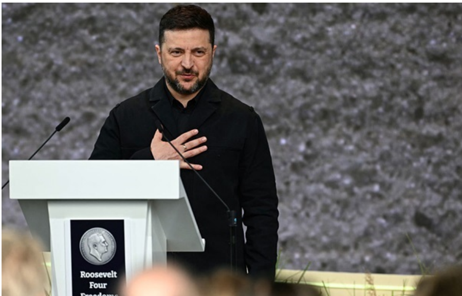
У Москві готові до реальних зустрічей

Президент України повідомив, що Путіна трошки підштовхнули і тепер він готовий до реальних зустрічей.