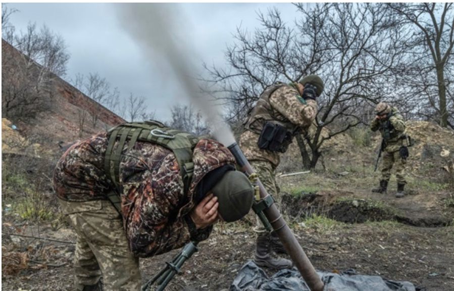
(ілюстративне фото)

У Міноборони з'ясувають, на якому етапі розпочалося порушення