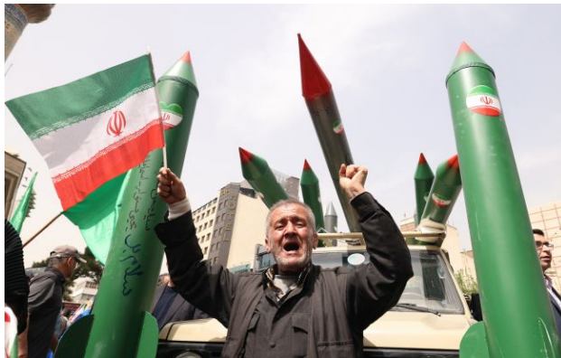
Фото: нова війна практично не дала ефекту

Обирайте перевірене - додайте РБК-Україна до улюблених джерел у Google