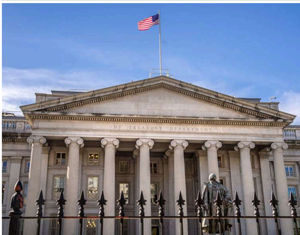
США та Україна обговорили роботу фонду URIF: схвалена перша інвестиція у відновлення

Прем'єр-міністр Свириденко обговорила з міністром фінансів США Бессентом діяльність фонду в рамках ресурсної угоди, повідомляє Мінфін США.