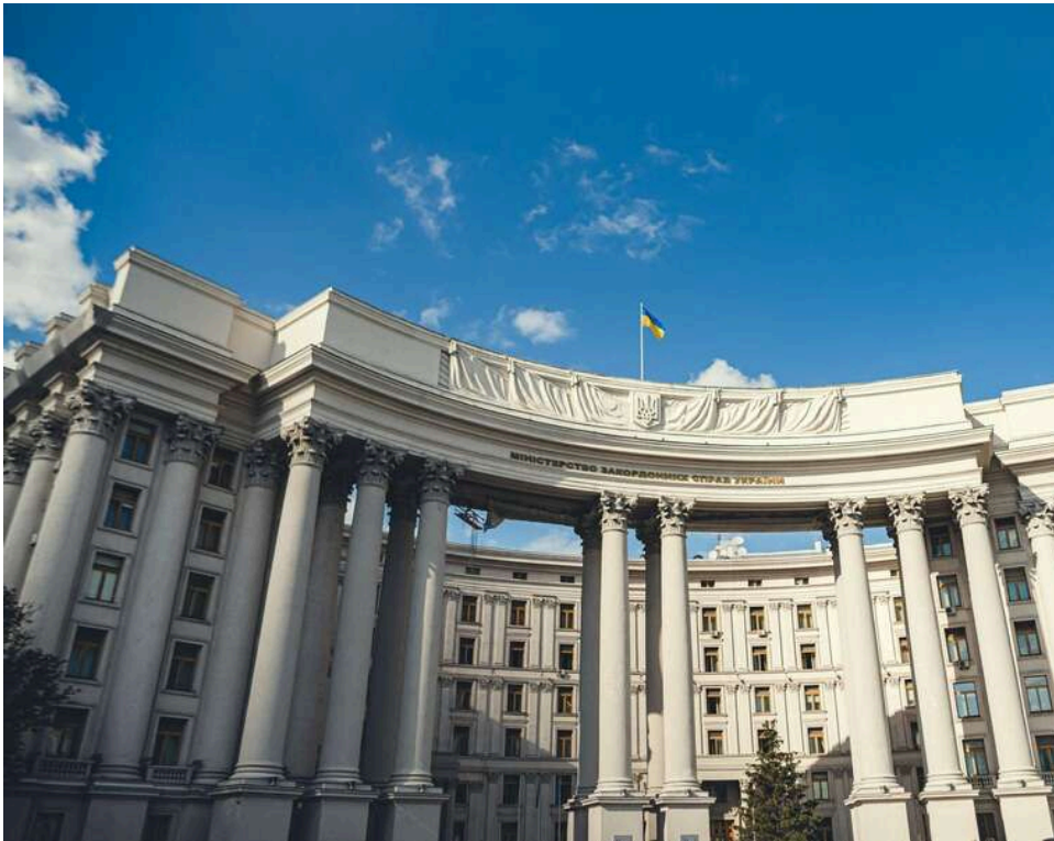
Гроші як зброя: Уряд офіційно прирівняв фінансову допомогу партнерів до військової техніки

Новий урядовий механізм централізує закупівлі через Агенцію оборонних закупівель та впроваджує алгоритм погоджень із партнерами.