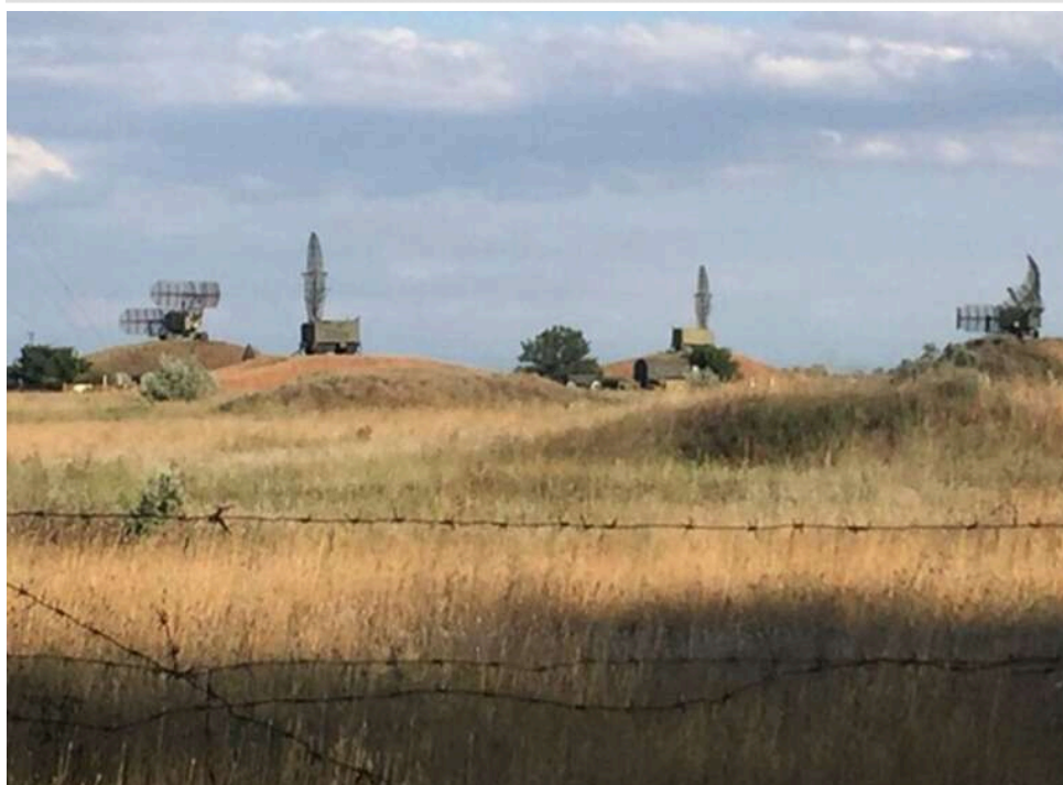
Загадкові бази РФ: на трьох віддалених локаціях з'явилися однотипні військові об'єкти невідомого призначення

Три типових об'єкти були розгорнуті окупантами з 2022 року на колишній базі зберігання ядерного озброєння в анексованому Криму, полігоні де випробовують "Буревестник", в Архангельській області та на покинутому танковому стрільбищі на Ладозі.