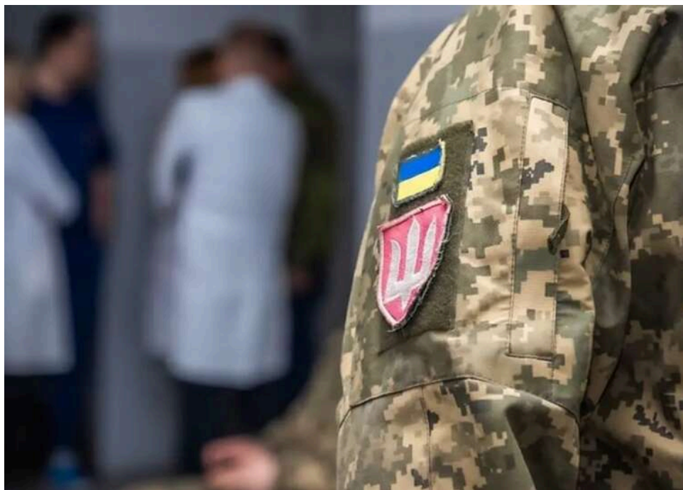
Одеський обласний ТЦК підтвердив напад на своїх співробітників

Одеський обласний ТЦК підтвердив отримання ножових поранень двома своїми співробітниками.