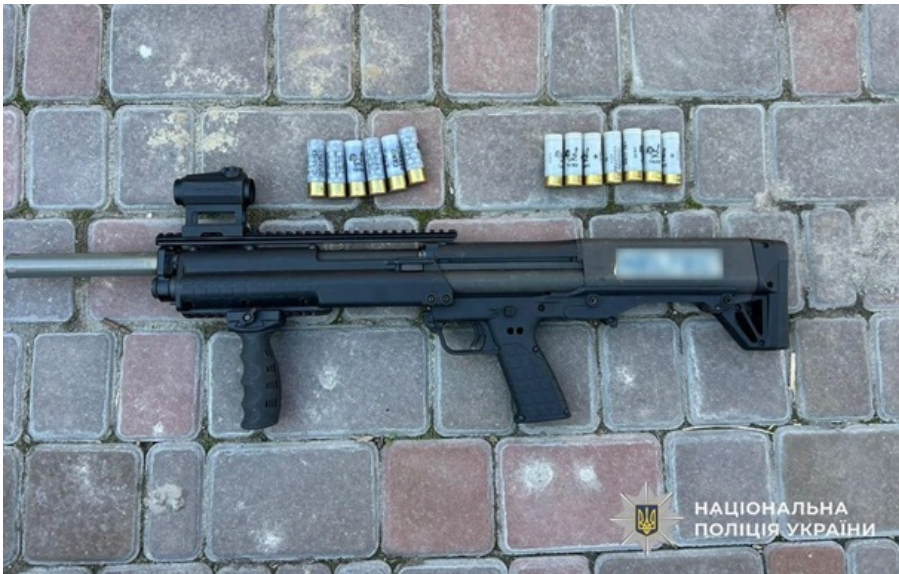
У затриманих вилучили зброю

Серед затриманих – двоє мешканців Кам'янського та один житель Кропивницького. Їм вже повідомили про підозри.