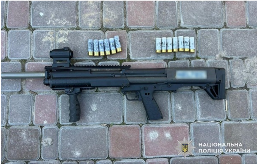
У затриманих вилучили зброю

Серед затриманих – двоє мешканців Кам'янського та один житель Кропивницького. Їм вже повідомили про підозри.