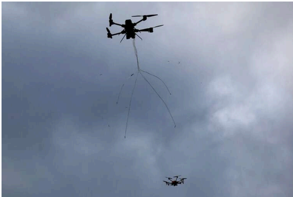
Російський FPV-дрон атакував авто біля аптеки у Слатиному: постраждав 74-річний переселенець

Російський fpv-дрон атакує цивільну автівку, припарковану поруч з аптекою у Слатиному Дерганівської громади Харківської області. Унаслідок удару постраждав власник машини.