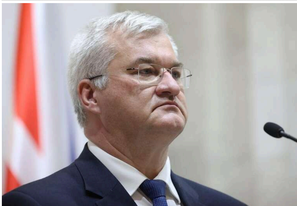
Сибіга: Російська РЕБ навмисно відводить українські дрони в бік країн НАТО

Російська РЕБ навмисно відводить українські дрони на територію країн НАТО. Україна запропонувала допомогу у запобіганні таким інцидентам.