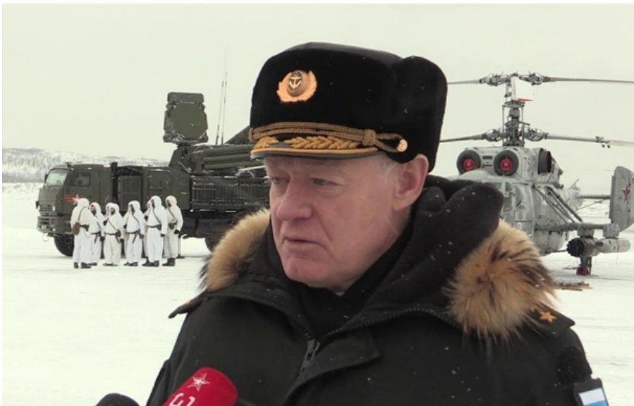
Олександр Отрощенко командував авіаційним корпусом Північного флоту РФ

Олександр Отрощенко став 14 російським генералом, який загинув із початку великої російсько-української війни.