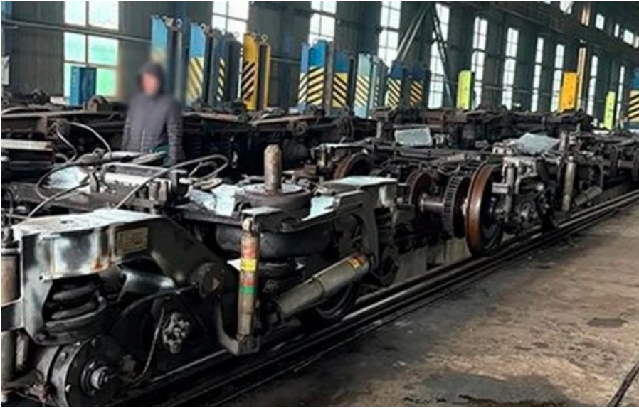
Укрзалізниця отримала вагони, що не витримали навіть кількох років експлуатації