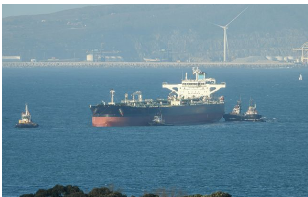
Фото: Британія лише допомагає в операціях із захоплення російських танкерів

Військово-морський флот Британії так і не затримав жоден підсанкційний нафтовий танкер РФ. Причиною стало побоювання, що швартування та обслуговування суден може коштувати десятки мільйонів фунтів стерлінгів.