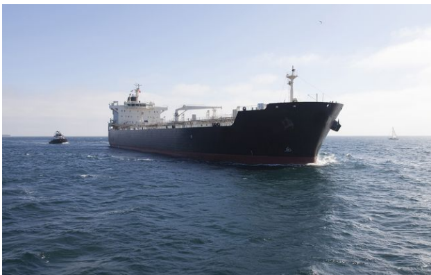
Фото: Британія лише допомагає в операціях із захоплення російських танкерів (Getty Images)

Військово-морський флот Британії так і не затримав жоден підсанкційний нафтовий танкер РФ. Причиною стало побоювання, що швартування та обговорення суден може коштувати десятки мільйонів фунтів стерлінгів.