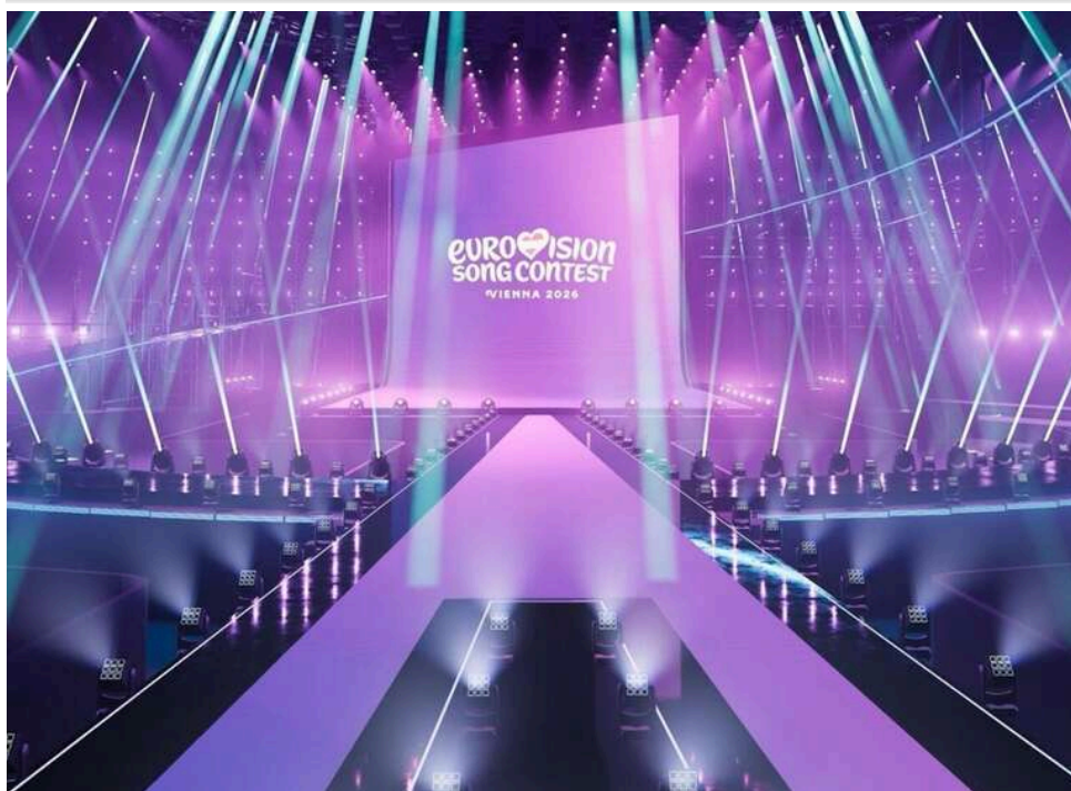
«Євробачення-2026» стартує у Відні: ювілейний конкурс під тиском бойкотів і політичних скандалів

Сьогодні у Відні починається “Євробачення-2026”. Цей ювілейний 70-й конкурс ще до старту перетворився на один з найскандальніших і найбільш політизованих за всю історію.