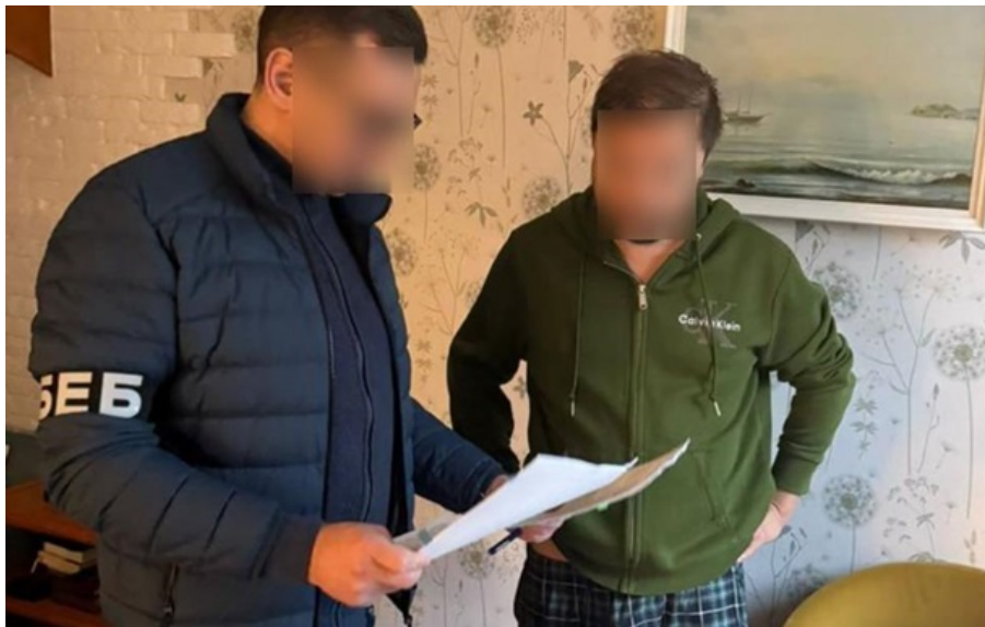
Вживаються заходи для притягнення до відповідальності всіх учасників схеми

Схема полягала у привласненні коштів, виділених на закупівлі держкомпанії. Це відбувалося за рахунок штучного завищення вартості матеріалів, необхідних для видобутку газу.