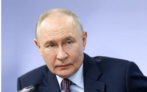
Фото: російський диктатор Володимир Путін

Обирайте перевірене - додайте РБК-Україна до улюблених джерел у Google