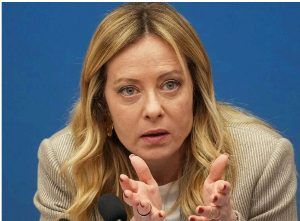
Кінець «безпекової парасольки» США: Джорджа Мелоні закликала Європу до негайної автономії в обороні

Джорджа Мелоні вирішила більше не будувати ілюзій і прямо заявила: епоха тотальної залежності від США у питаннях безпеки добігає кінця. На тлі чуток про плани Дональда Трампа скоротити американський військовий контингент в Італії та Іспанії, прем'єрка закликала європейських лідерів прокинутися.