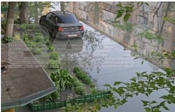
Фото: Ваза У місті ввели режим НС муніципального рівня

Російське місто, звідки ворожі бомбардувальники летять атакувати Україну, заливає нечистотами.