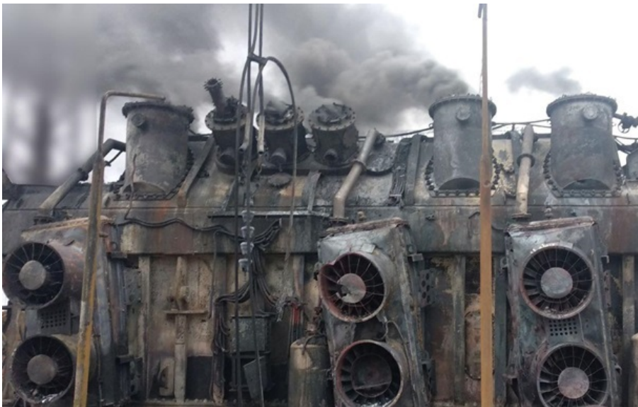
Пошкоджений енергетичний об'єкт (архівне фото)

Найскладніша ситуація зараз на Чернігівщині, де через пошкодження ворогом кількох енергооб'єктів знеструмлена найбільша кількість споживачів.