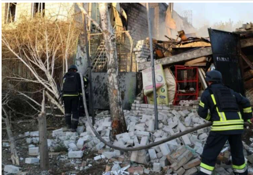
У Миколаївській області внаслідок удару дрона постраждали двоє осіб – чоловік і жінка похилого віку

Війська РФ атакували FPV-дроном цивільний автомобіль у Миколаївському районі.