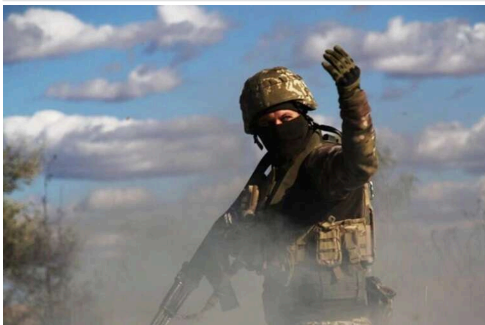
Ситуація на фронті: з початку доби росіяни здійснили 60 атак на позиції Сил оборони

Станом на 16:00 травня росіяни 60 разів атакували позиції Сил оборони. Найбільше боїв пройшло на Покровському напрямку.