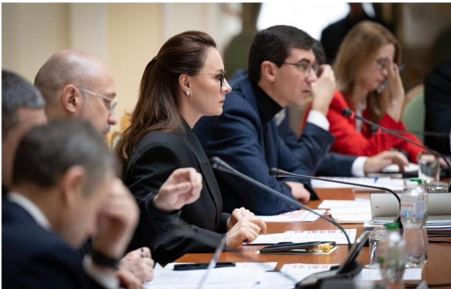
Свириденко провела зустріч із керівниками комітетів Верховної Ради

До порядку денного парламенту будуть внесені термінові законопроекти, щодо яких є порозуміння, зазначила глава уряду.