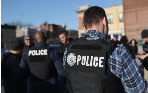
Фото: поліція проводить зараз розслідування

Обирайте перевірене - додайте РБК-Україна до улюблених джерел у Google