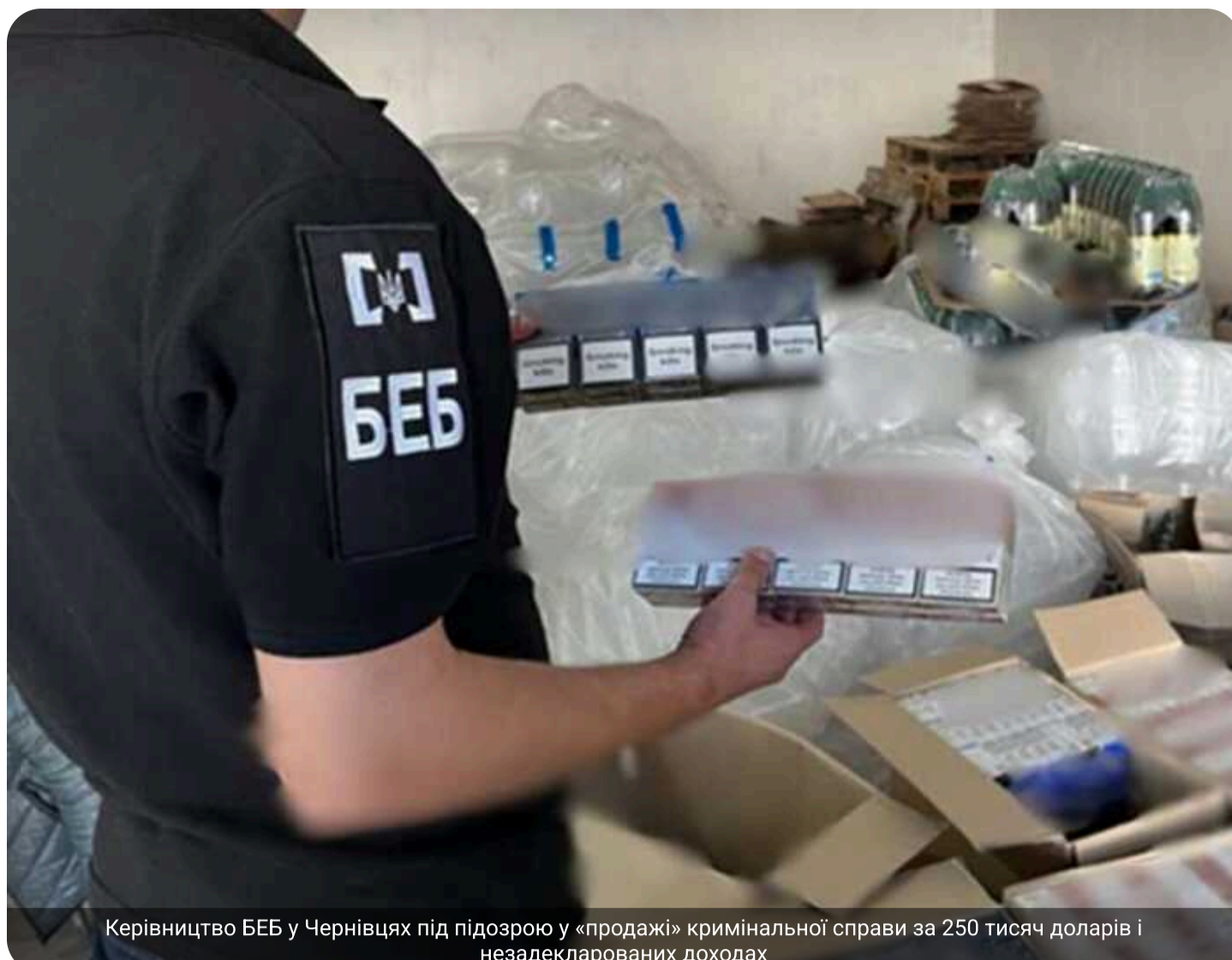
Керівництво БЕБ у Чернівцях під підозрою у «продажі» кримінальної справи за 250 тисяч доларів і незадекларованих доходах